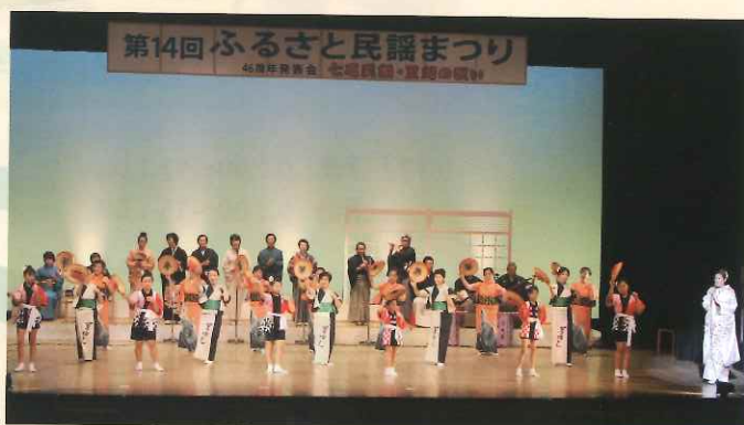
(2016年6月20日付北國新聞より)

主催 七尾市文化協会 入場無料 共催 七尾市教育委員会 後援 北國新聞社・テレビ金沢・ラジオななお 西湊地区コミュニティセンター 主管 ふるさと民謡まつり実行委員会 七尾民謡会