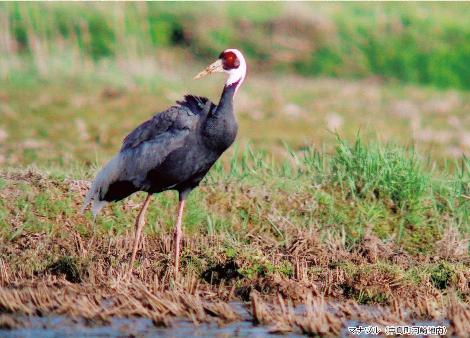
マナヅル (中島町河崎地内)