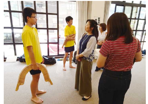
南砺平高等学校郷土芸能部視察

また、昨年度実施した南砺平高等学校郷土芸能部への視察も引き続き実施し、同年代の高校生にも働きかけ同行できるように計画します。夏休みの期間に一同に会して文化体験ができるようなイベントも検討中です。