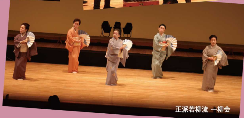
正派若柳流 一柳会