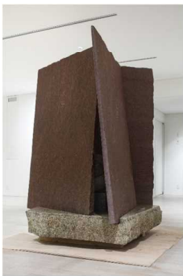
「前橋の美術2017」展覧作品 Bud-dhism=芽・蕾

七尾の日本のデカ山がユネスコ無形文化遺産になりましたが、お世話になった老舗のある一本杉通りの皆さんや七尾市の活躍にも、未来を造る若い能登人にも、そのデカ山のユニークな造形とスケール感の影響は大きく関わっていきと思っています。