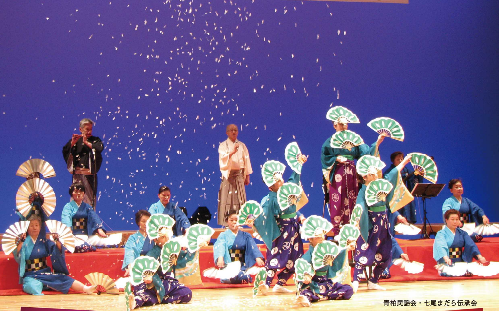
青柏民謡会・七尾まだら伝承会

主催 / 七尾市文化協会 共催 / 七尾市教育委員会 主管 / 七尾市民音楽祭実行委員会